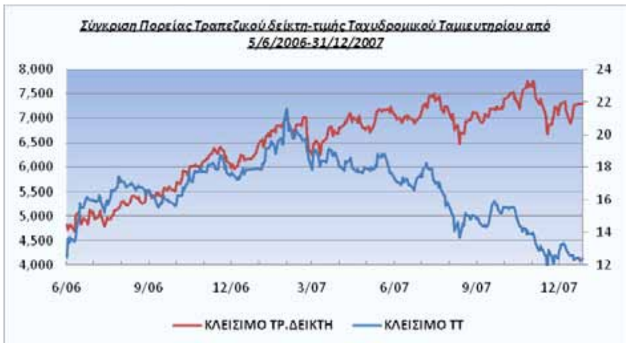
Γράφημα II : Σύγκριση της εξέλιξης του Κλαδικού Τραπεζικού Δείκτη του Χρηματιστηρίου Αθηνών και της τιμής της μετοχής του Ταχυδρομικού Ταμιευτηρίου, από την ημέρα έναρξης διαπραγμάτευσης της μετοχής (05/06/2006), μέχρι και 31/12/2007