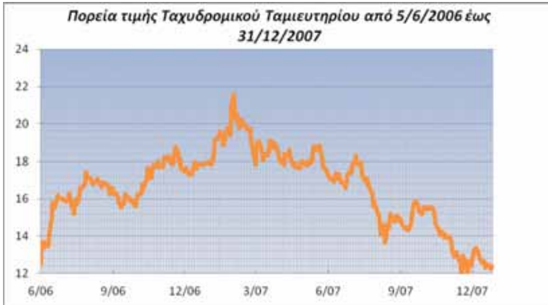
Γράφημα I : Πορεία της μετοχής του Ταχυδρομικού Ταμιευτηρίου από την πρώτη ημέρα έναρξης των συναλλαγών στο Χρηματιστήριο Αθηνών (05/06/2006) μέχρι και 31/12/2007.