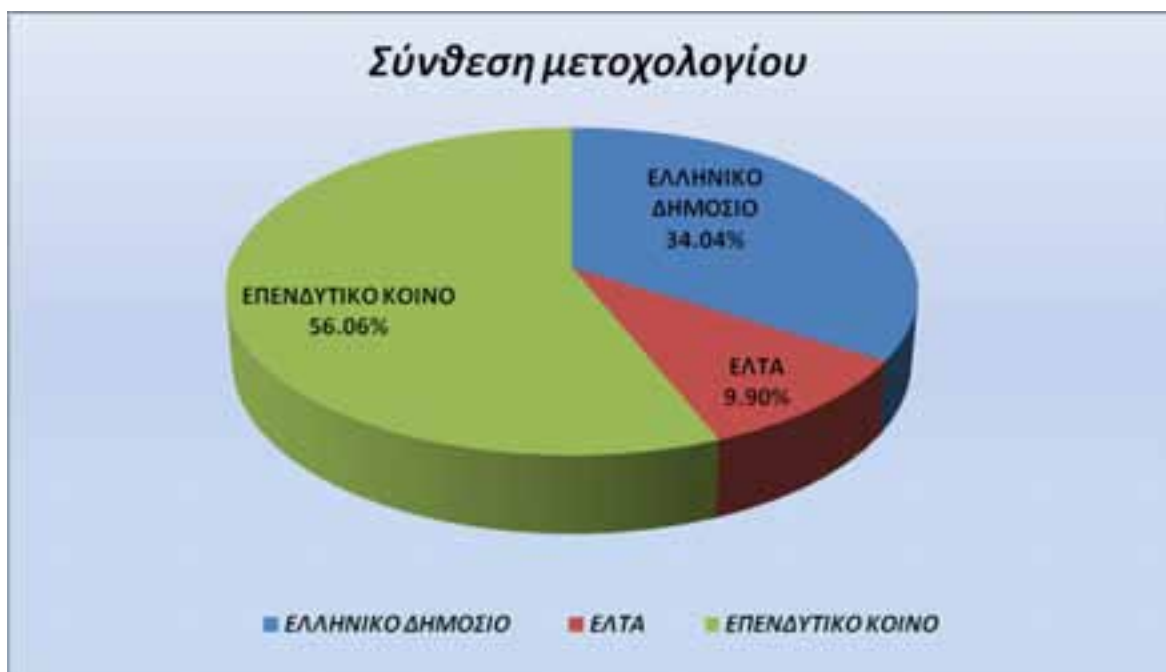
Γράφημα IV : Σύνθεση του μετοχολογίου της Τράπεζας 31/12/2007.